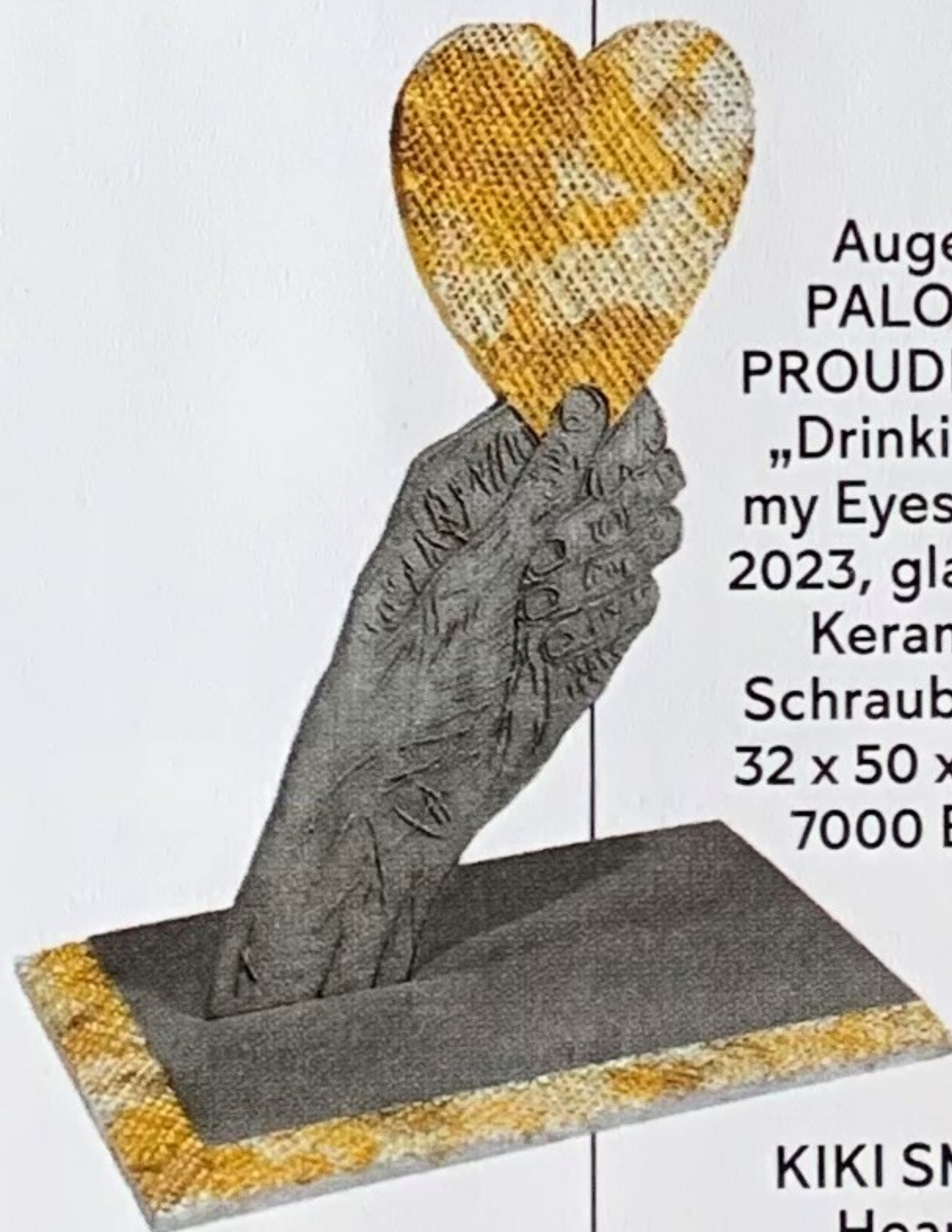
Augen: PALOMA PROUDFOOT „Drinking in my Eyes (IV)“, 2023, glasierte Keramik, Schrauben, je 32 x 50 x 4 cm, 7000 Euro