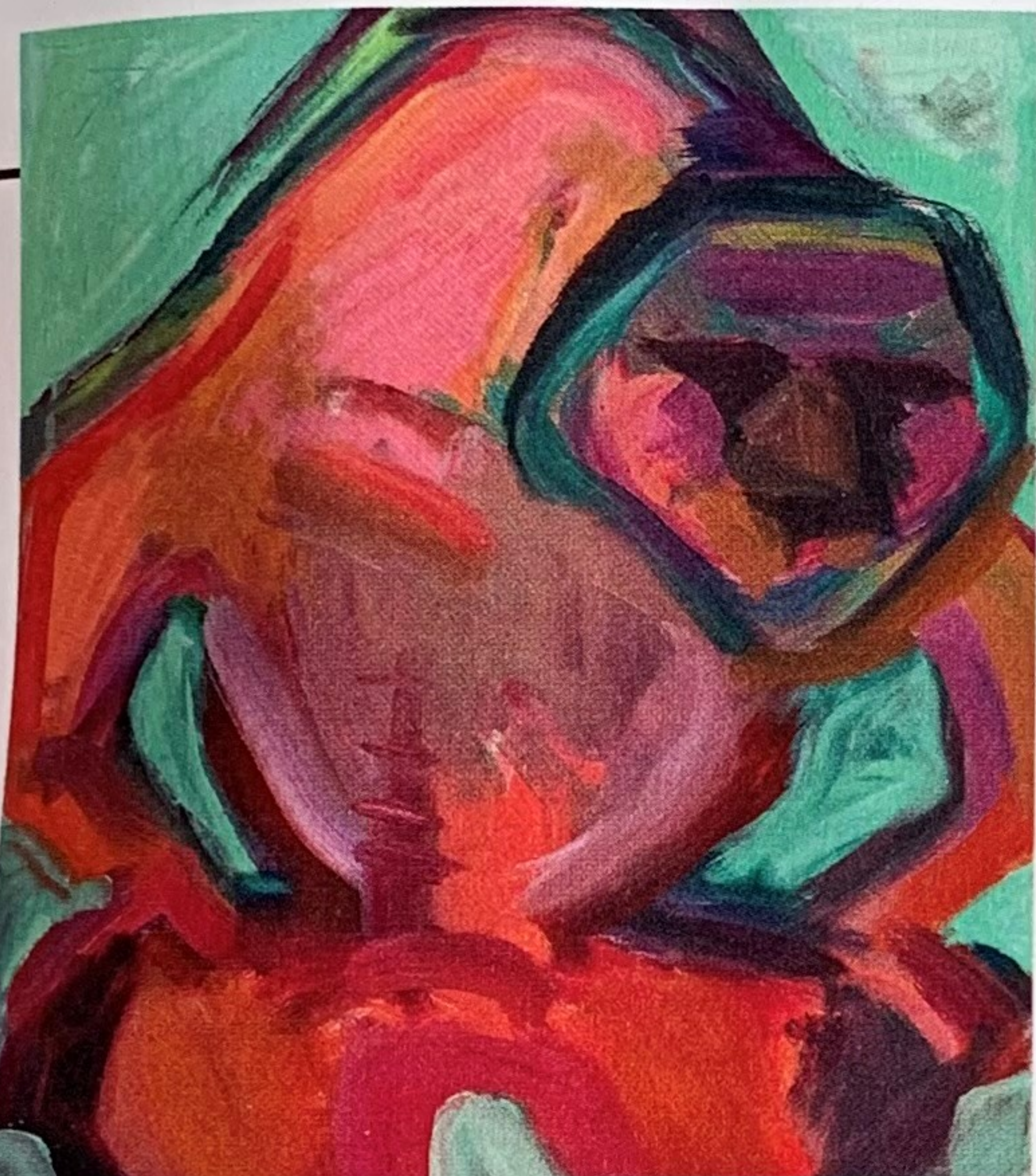
MARIA LASSNIG „Der rote Zorn“, 1984, Öl auf Leinwand, 72 x 65 cm, 180 000-250 000 Euro