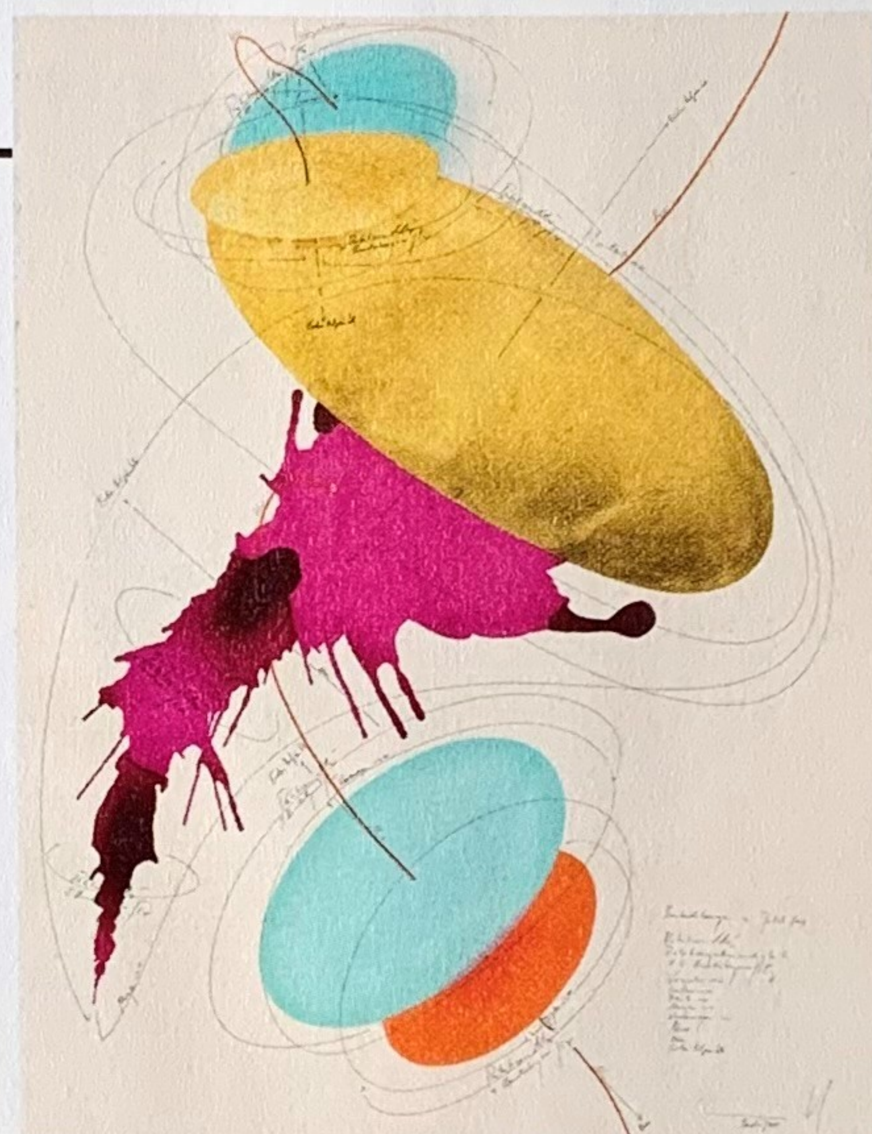
JORINDE VOIGT „Beobachtungen im Jetzt (12)“, 2015, Tinte, Tusche, Blattgold, Ölkreide, Pastell, Bleistift auf Papier, 76 x 56 cm, 28 000 Euro