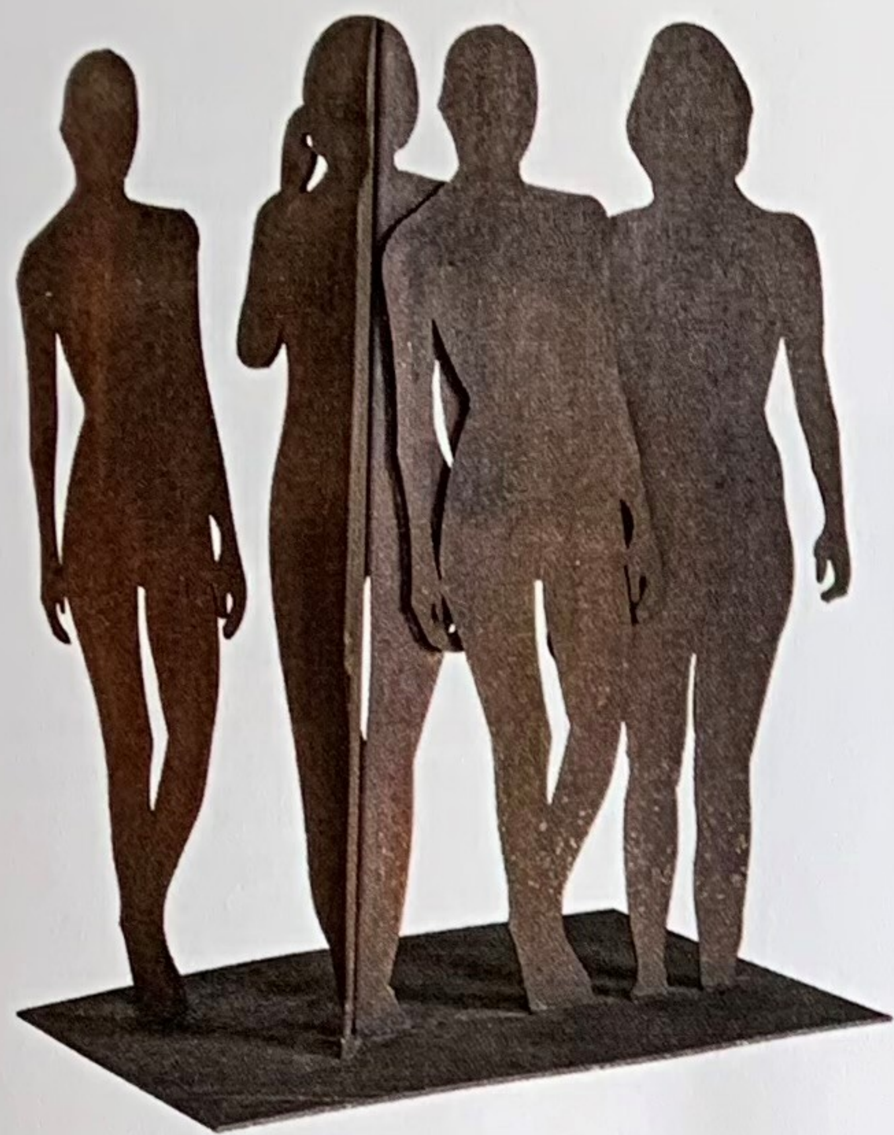
WERNER BERGES „Jede Menge Leute“, 2003, Cortenstahl mit natürlicher Rostpatina, 95 x 66,5 x 50 cm, Limit: 2000 Euro