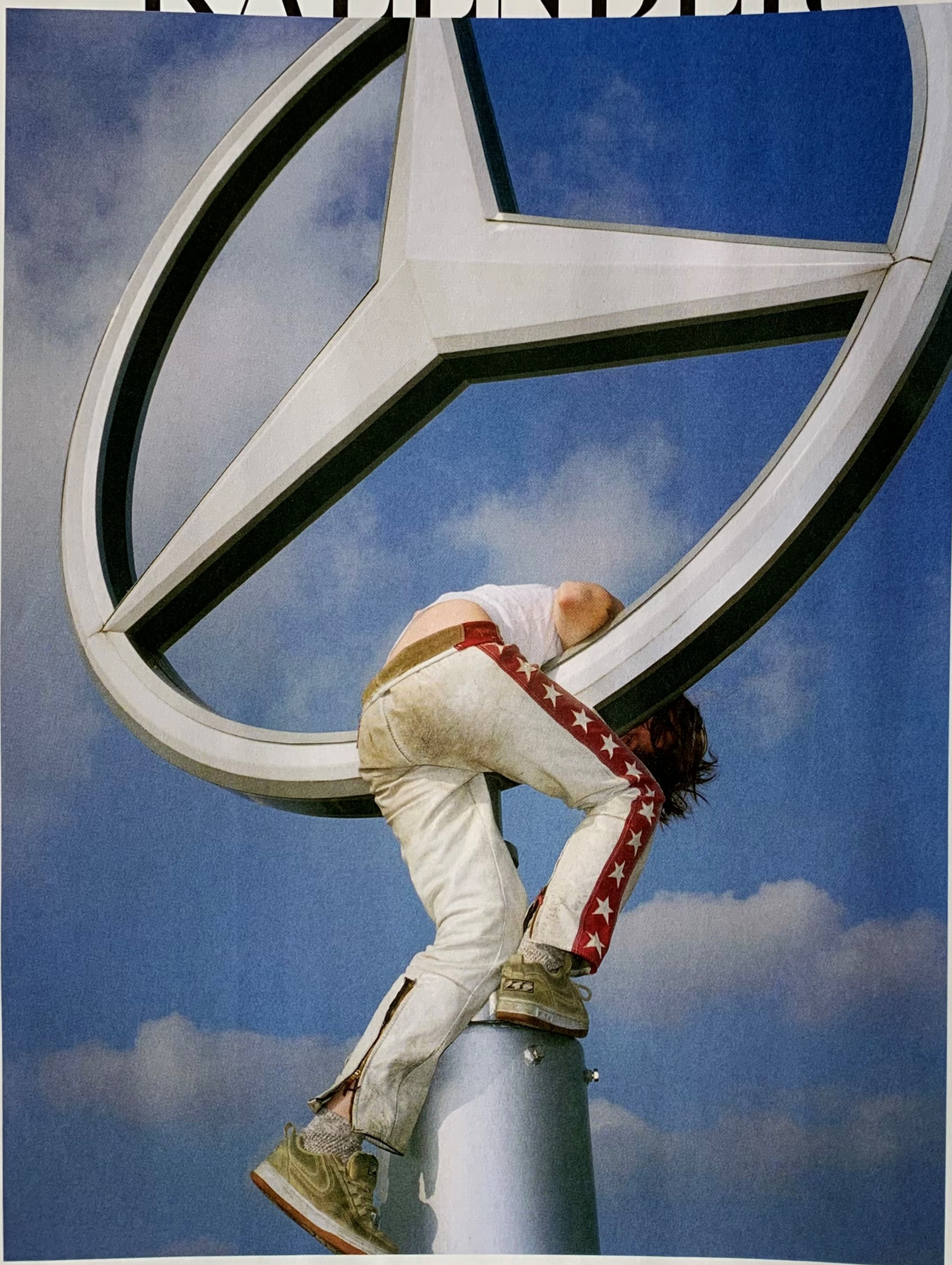
KETTERER, 18. November*: DANIEL JOSEFSOHN „Die neue S-Klasse“, 1998, analoger C-Print auf Fujicolor Professional Paper Maxima Glanz, auf Alu-Dibond montiert und gerahmt, 120 x 90 cm, 14.100 Euro

*eine Benefizauktion von PIN. Freunde der Pinakothek der Moderne