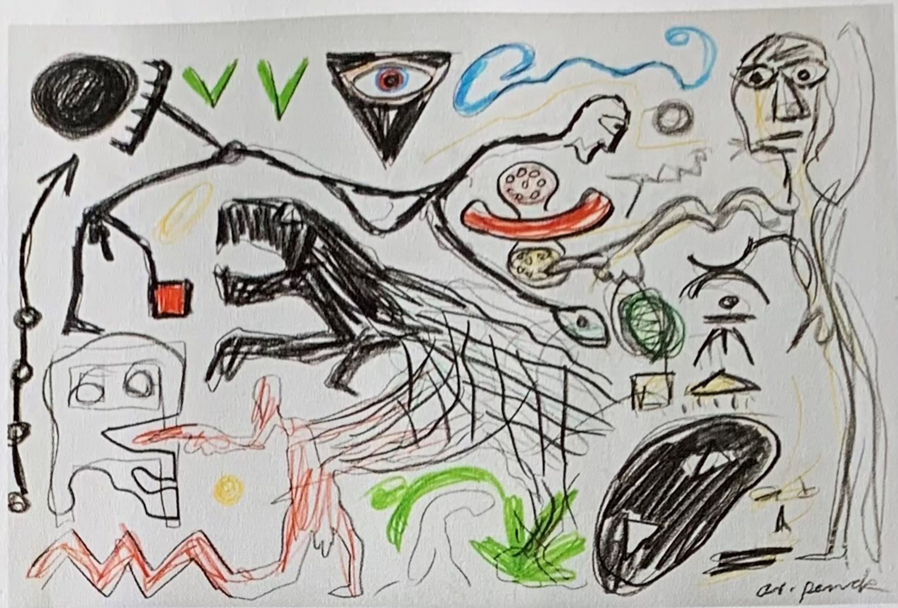
A.R. PENCK „Missverständnis“, vor 2001, Wachskreide auf Velin, 32,5 x 47,5 cm, Limit: 6000 Euro